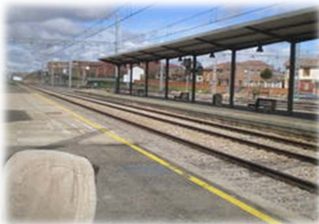
Estación de Sahagún, con su marquesina.