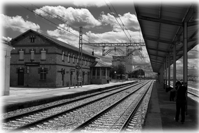
Estación de Paredes de Nava, con su marquesina.

Estas marquesinas se han basado en las existentes hoy en día en las estaciones de la línea Palencia- León, y León - Galicia. Así podemos verlas en estaciones como las de Paredes de Nava, Villada, Sahagún o Astorga entre las más destacables. A continuación, podréis observarlas. La longitud más común es de 50 metros, pero las hay de 80 metros e incluso de más de 100 metros.